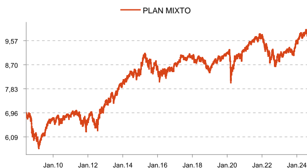
Errentagarritasun EUS PENT MIXTO